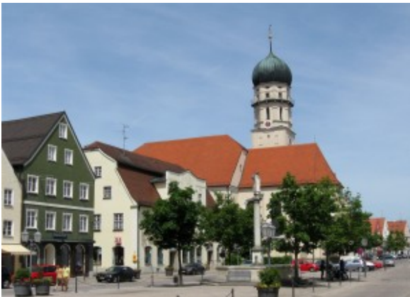
Schongauer Marienplatz – geplante Fußgängerzone

Sanierung der Schul- und Sportanlagen und des heruntergekommenen Bahnhofs, mehr Freizeitangebote für Jugendliche wie Bolzplätze oder einen Bike- & Skater-Park. Fragen der Verkehrs-Infrastruktur und der (regenerativen) Energieversorgung harren der Lösung. Es gab und gibt die Feilschereien um Zuschüsse für Sport und Kultur (die meisten Stadträte sind stimmsicherheitshalber ja in mehreren Vereinen Mitglied) und in jüngster Zeit auch eine Auseinandersetzung um das leerstehende ehemalige Schongauer Forsthaus, das als Heim für Asylbewerber angedacht war. Aus Teilen der CSU waren alsbald fremdenfeindliche Töne zu hören, es hieß dort, das Forsthaus könne man "für was Besseres als Asylanten nutzen". Das kam in Schongau, wo seit Jahrzehnten viele Italiener, Griechen, Türken und andere 'Migranten' ziemlich problemlos im Sozialgefüge integriert sind, gar nicht gut an.