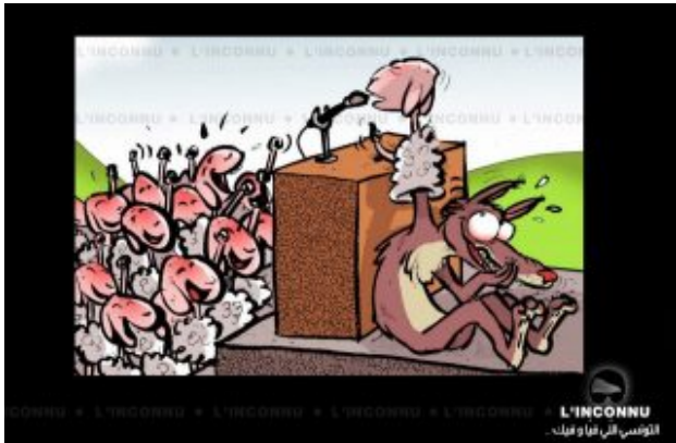
“Wolf im Schafspelz” (von L'inconnu)

Informationen über das Internet verbreitet hatte. In jener Zeit erfuhr er Schikane und wurde bei Verhören gefoltert, worauf er u.a. in sieben Hungerstreiks trat, bevor er 2005 im Alter von 36 Jahren an einem Herzinfarkt verstarb. Er sollte der erste Märtyrer der tunesischen Blogger werden, doch anstatt abzuschrecken, verlieh sein Tod der immer größer werdenden Szene nur noch mehr Nachdruck und Beharrlichkeit.